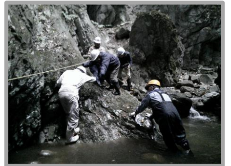
(化石魅力化プロジェクト：鬼釜現地調査)

■専門部会連絡協議会 2.18 協議：各部会の令和6年度事業進捗・次年度事業計画/予算