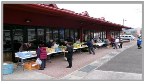
(わくわく農業：ゆき軽トラ朝市)