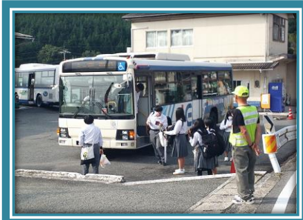
登校風景(油木高校9/2)

令和6年度2学期が始まりました。まだまだ残暑も続き、また、台風等による自然災害も心配されますが、先生も児童生徒の皆さんも、体調を整えて元気に「収穫の秋」を迎えて下さい。1日のスタートは「朝食」から。「早寝早起き朝ごはん」の規則正しい生活習慣が大切です。