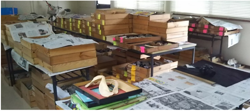
仮収納庫に移動させた化石